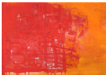
„Freude erleben“ von Gisela Späth