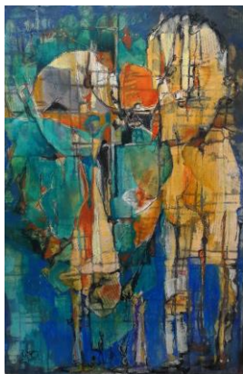
„Aux Coeurs“ von Veronique Götzmann