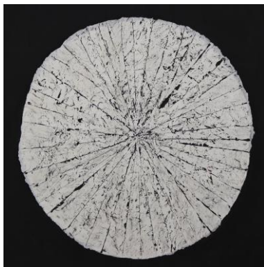
„Kreis der Unendlichkeit“, Collage von Gisela Späth